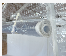
出入口は巻上げ式